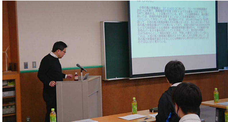
日本分散型風力発電協会 久保理事長