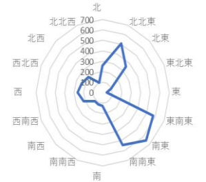
風向頻度レーダーチャート